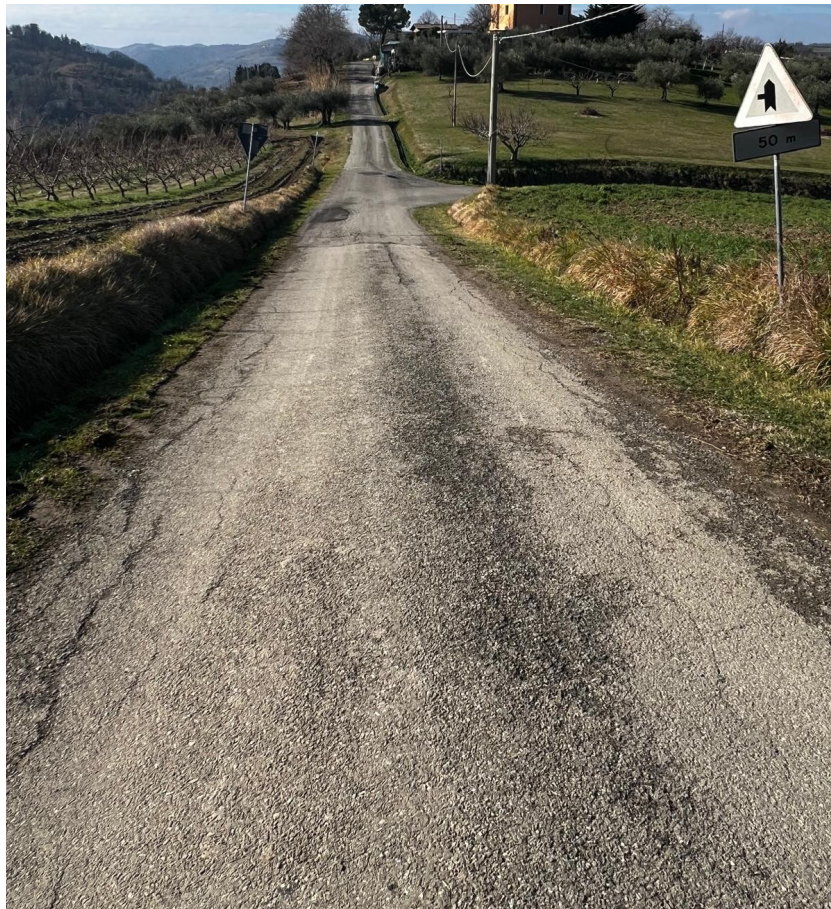
TRATTO 1 – VIA RIGONE TRATTO ASFALTATO