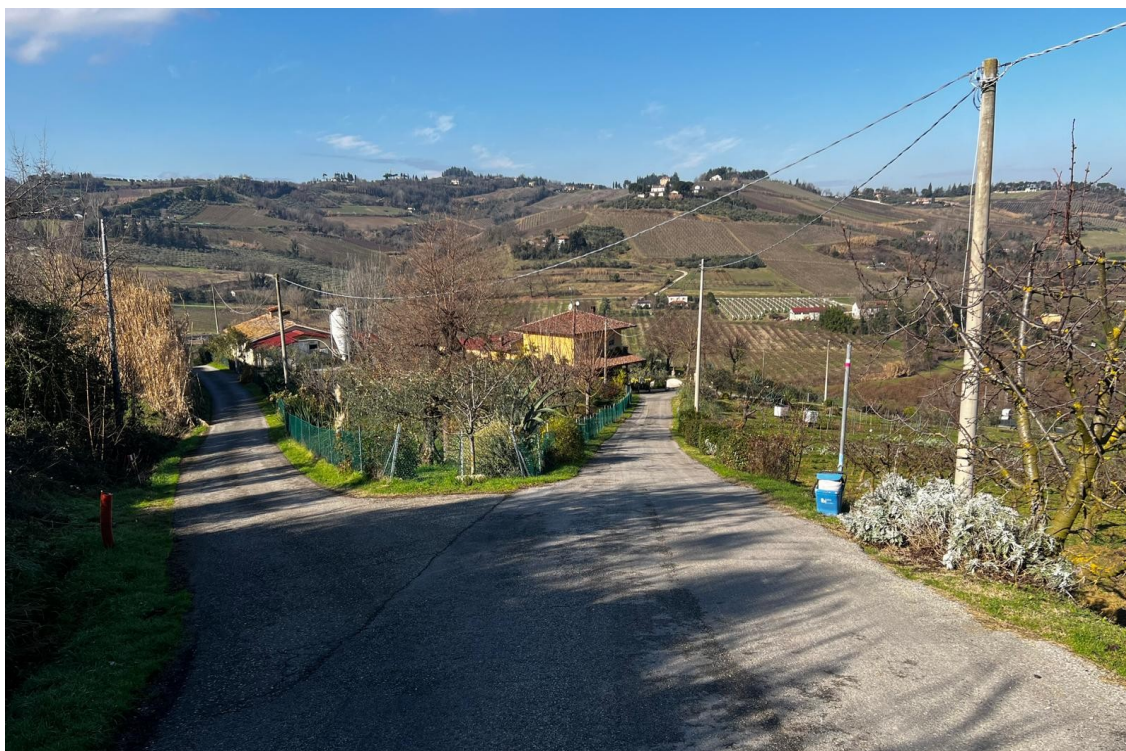
TRATTO 1 – ORIGINE DIRAMAZIONE VIA RIGONE