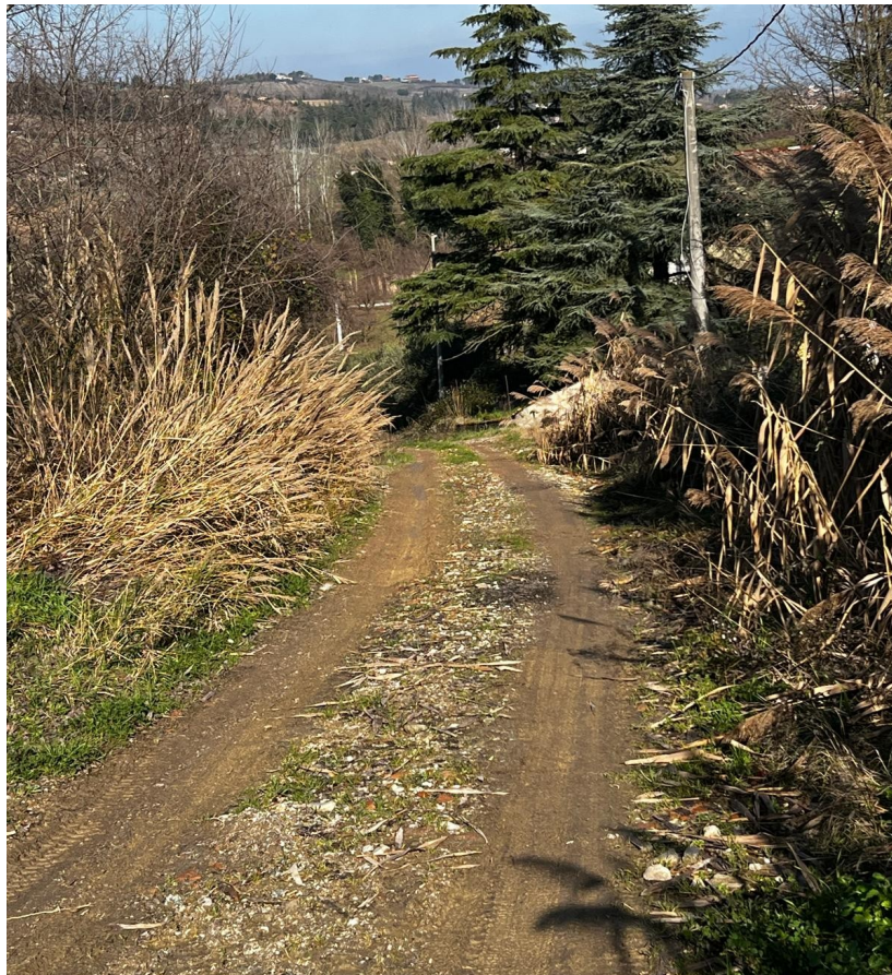
TRATTO 2 – VIA RIGONE IN TERRA BATTUTA