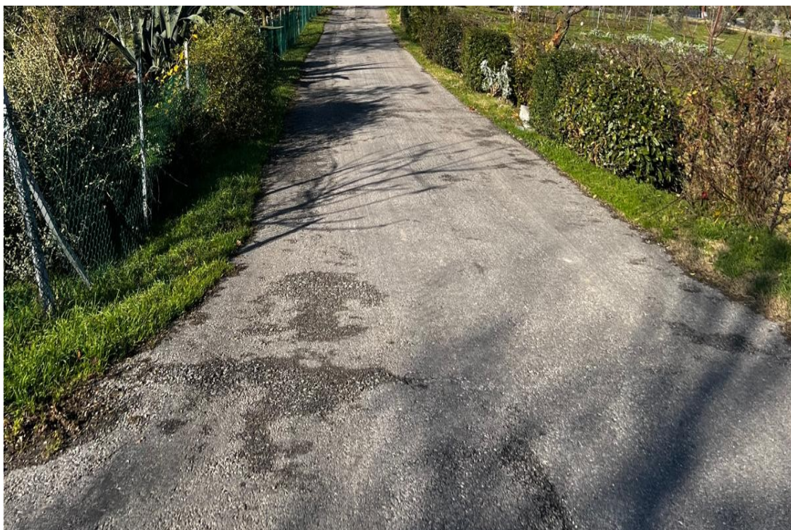
TRATTO 1 – VIA RIGONE TRATTO ASFALTATO DOPO DIRAMAZIONE