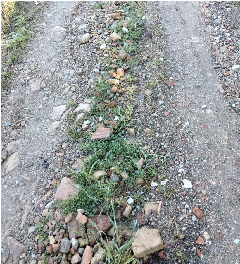
TRATTO 2 - DETTAGLIO FONDO STRADALE VIA RIGONE