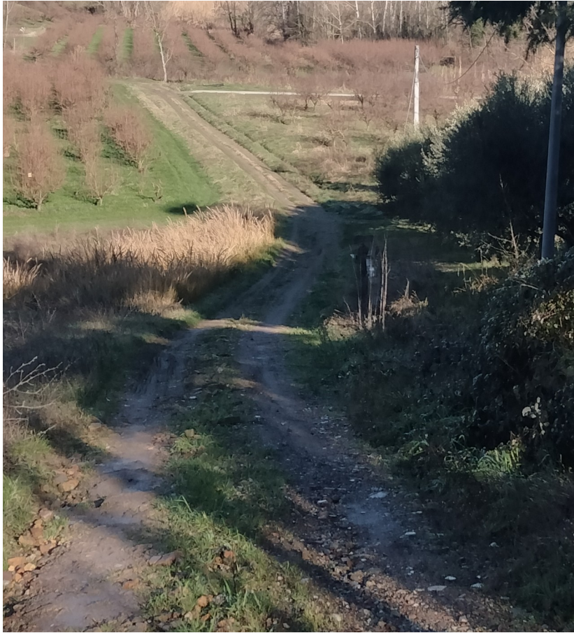
TRATTO 2 – TRATTO FINALE VIA RIGONE IN TERRA BATTUTA