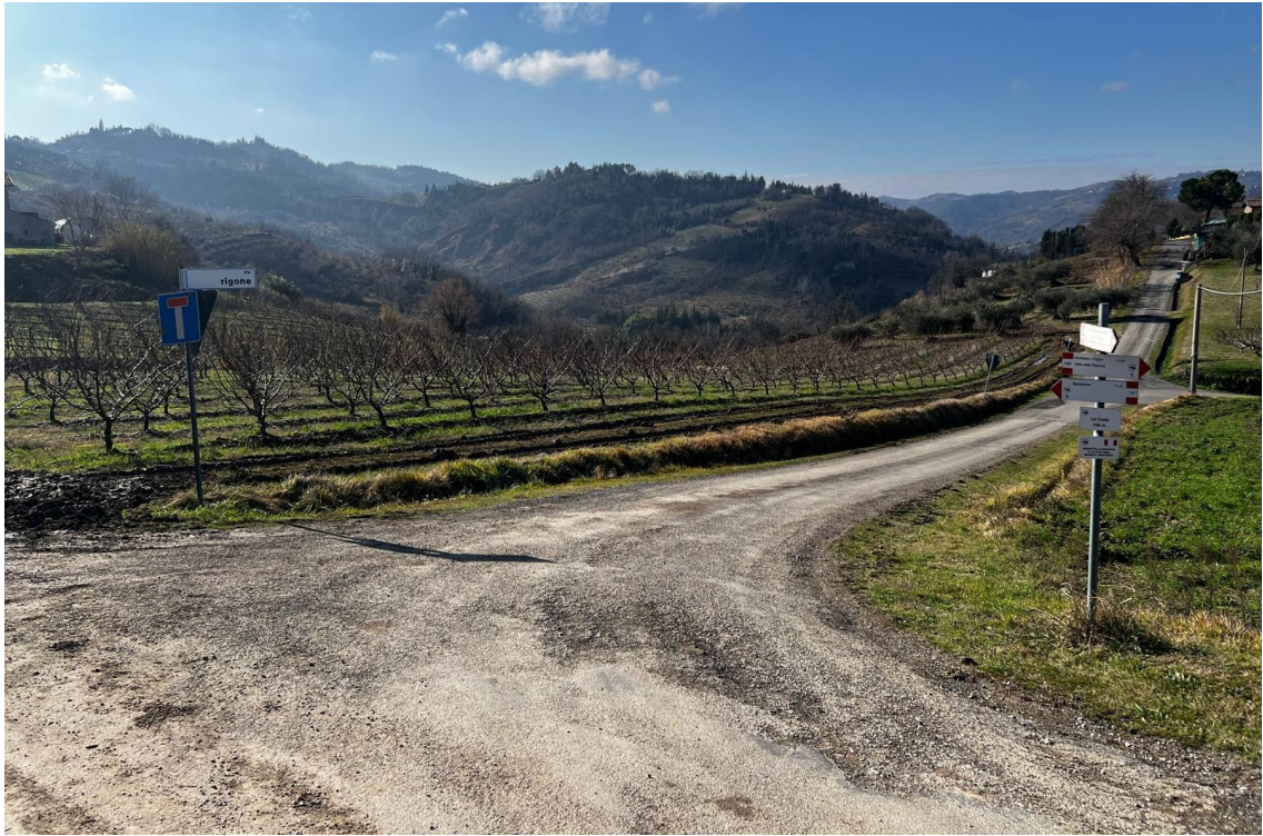
TRATTO 1 – ORIGINE DELLA VIA RIGONE