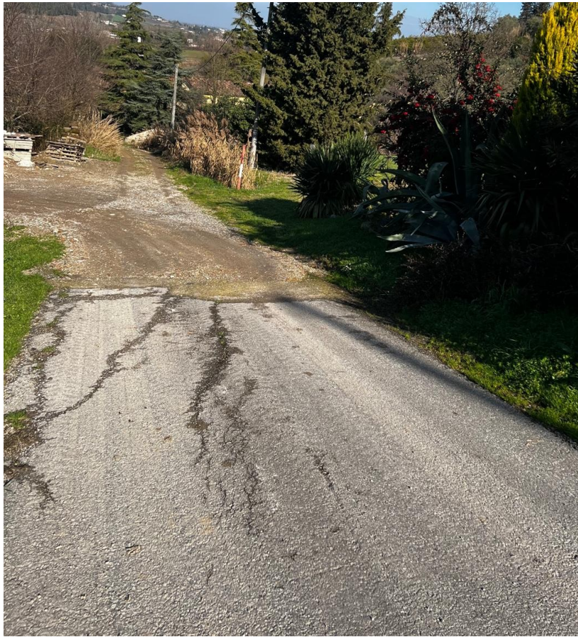
FINE TRATTO 1 ASFALTATO – INIZIO TRATTO 2 IN TERRA BATTUTA