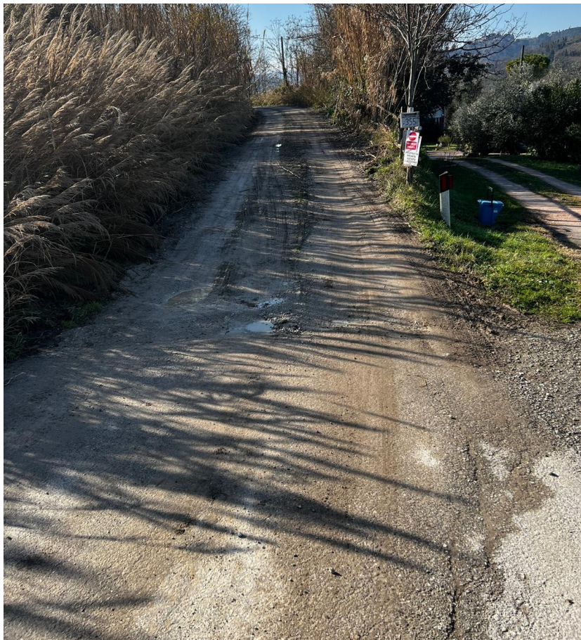
TRATTO 1 – DIRAMAZIONE AD USO PRIVATO VIA RIGONE